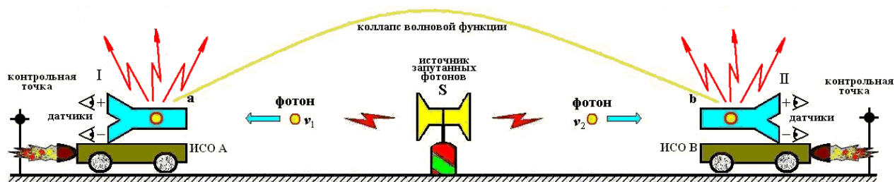
Рис.3 Две движущиеся инерциальные системы с точки зрения неподвижной ИСО. Источник запутанных фотонов неподвижен и фотоны из каждой пары приходят в движущиеся ИСО одновременно. Стрелки-молнии указывают на точки, в которых находились фотоны в момент коллапса волновой функции.

Движение двух ИСО А и В с точки зрения неподвижной ИСО происходит в сторону источника запутанных фотонов S с одинаковой удаленности от него таким образом, что фотоны v_1 и v_2 из каждой пары достигают каждый своей ИСО одновременно.